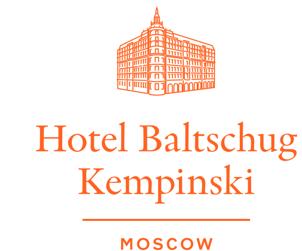
Отель «Балчуг Кемпински»